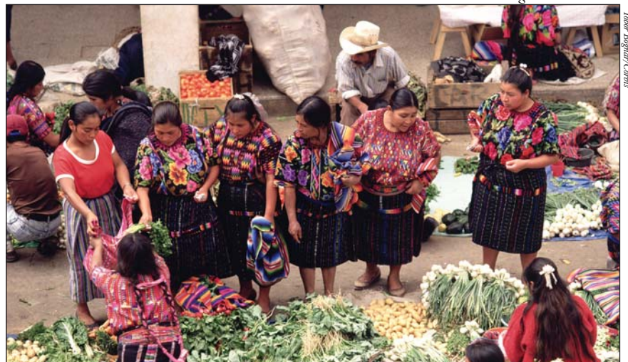
Marché de Chichicastenango au Guatemala

Le développement entraîne également dans son sillage un bouleversement de la vision du monde et des repères culturels ou encore de la religion cosmique auxquels les sociétés traditionnelles adhéraient. Ainsi, au lieu de voir notre bien-être et notre survie dépendre de la préservation de la structure essentielle du cosmos, cosmos que le monde « pré-développé » considérait comme englobant la société, le monde naturel et le monde des dieux (cf. mon ouvrage Le Tao de l'Écologie ), (9) nous voyons notre bien-être dépendre tout au contraire de la des-